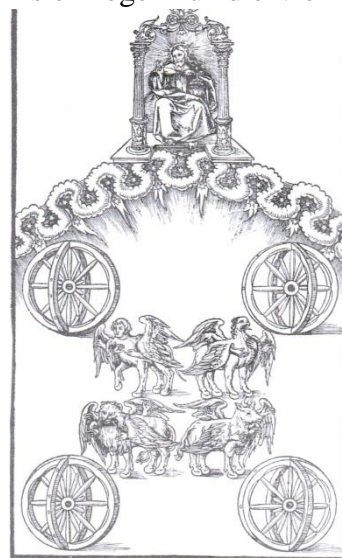
Thronwagenvision Hes 1 Holzschnitt von Lukas Cranach d. J. in der Wittenberger Bibel 1541

Hesekiel sieht auch die Throndiener, die vier Lebewesen (Hes. 1,5-10 – sie mögen für die vier Himmelsrichtungen stehen). Jedes dieser vier Lebewesen hat vier Häupter; sie sind gleich einem Löwen, einem Stier, einem Menschen und einem Adler (Hes. 1,10). In Hesekiel 10 sieht Hesekiel wieder den Thron Gottes verbunden mit den vier Lebewesen. Dort allerdings gleicht das zweite Gesicht einem Cherub (Hes. 10,14). Diese vier Lebewesen sind Cherubim (Hes. 10,15.20). Bei den Lebewesen ist das Räderwerk (hebräisch Galgal , Hes. 10,13), so dass sie nach allen Seiten fahren können, ohne sich umzuwenden (Hes. 10,11). Wenn die Lebewesen sich bewegen, dann bewegen sich die Räder auch (Hes. 1,19): Das weist auf die geistliche Einheit hin: Ein Vorbild für die Gemeinde Jesu. Sie haben Flügel, mit denen sie sich emporheben können (Hes. 10,19). Sie sind voller Augen, das heißt, sie können alles sehen und überblicken (Allsehenheit Gottes 1 , Hes. 10,12), ja sogar die Gedanken der Menschen (Hes. 11,5). Über dem Räderwerk mit den Cherubim befindet sich ein Thron (Hes. 1,26; 10,1). Es handelt sich also um etwas Ähnliches wie ein Thronwagen. Auf dem Thron saß jemand, der aussah wie ein Mensch (Hes. 1,27) – ein Hinweis auf JESUS? Oder ein Hinweis auf Gott (vgl. Dan. 7,9)? Das Angesicht konnten die Propheten Hesekiel und Daniel auf jeden Fall nicht sehen! Auch Johannes bezeugt, dass jemand auf dem Thron saß, mehr sah er nicht (Offb. 4,2).