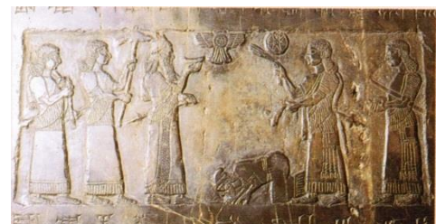
Jehu von Samaria kniet vor dem assyrischen König Salmanassar III.